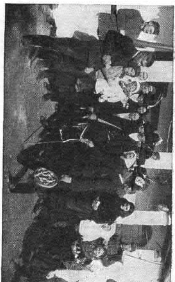
100. A vőlegény kikérése (Boldog, Pesti vm.)