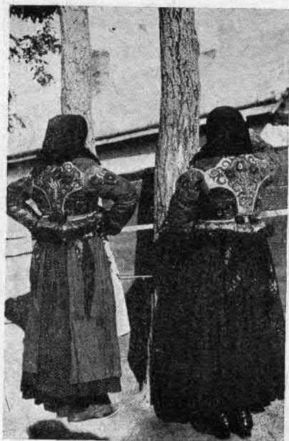
87 Asszonyok rátétes és hímzett bőrködmönben (Cigánd, Zemplén vm.)