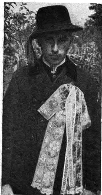
97. Vőfély (Martos, Komárom vm.)