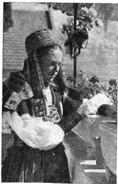
93. Torockói leány