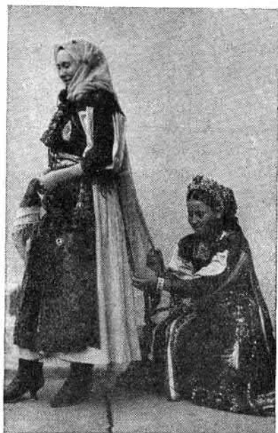
94. Fialat asszony és leány (Daróc, Kolozs vm.)