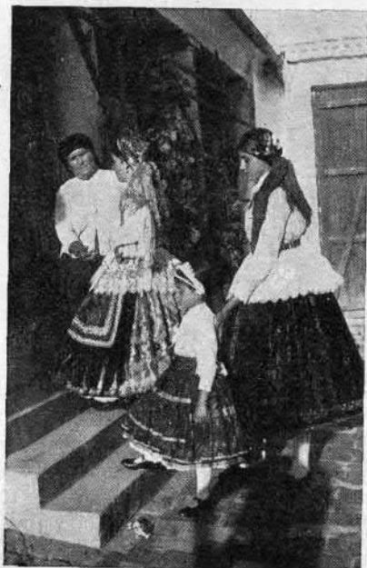
89. Sárközi viselet (Sárpilis, Tolna vm.)