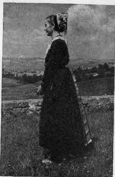
88. Fiatal menyecske főkötővel (Bélapátfalva, Borsod vm.)