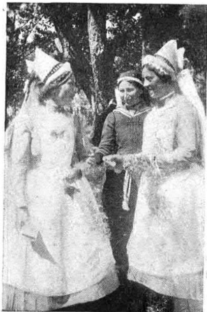
91. Szuhai nők (Heves vm.)