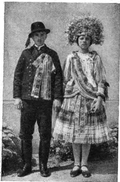
95. Vőlegény és menyasszony (Martos, Komárom vm.)