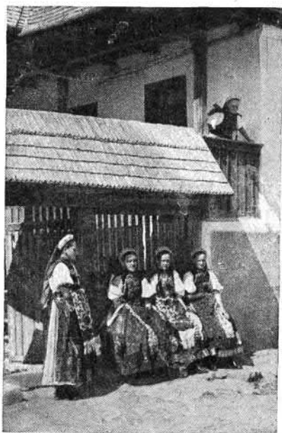
92. Körösfői leányok (Kolozs vm.)