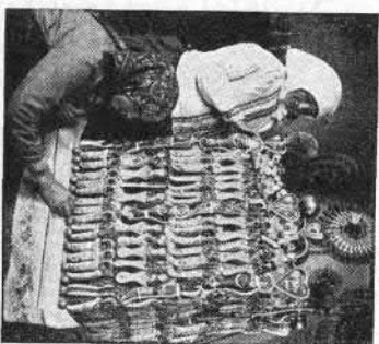
102—103. Lakodalmi kalács és torta (Boldog, Pesti vm.)