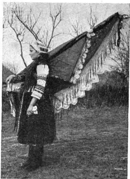
98. Lakodalmi zászló (Menyhe, Nyitra vm.)