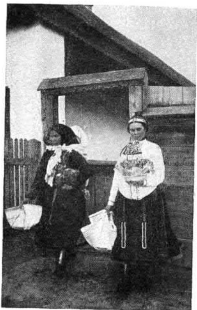
96. Lakodalmi ajándékokat hozó asszonyok (Boldog, Pest vm.)