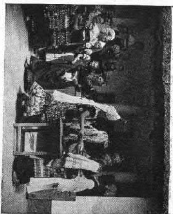
99. Mezőkövesdi lakodalom