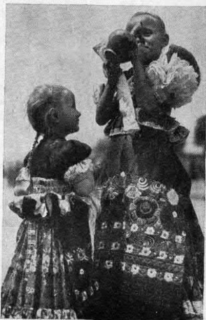
90. Mezőkövesdi kisleányok