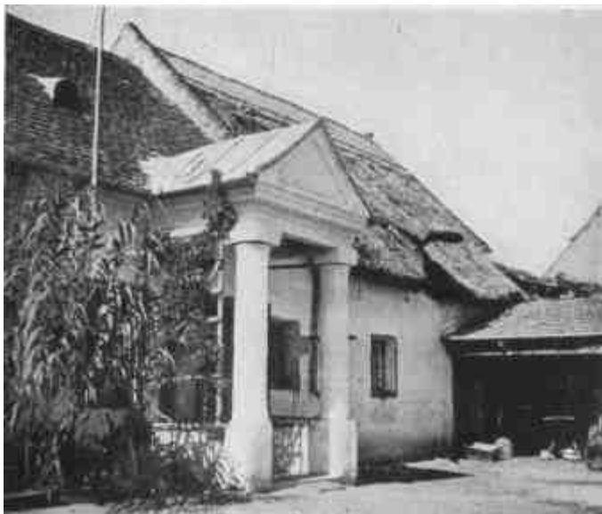
Nemespécseli parasztház oszlopos tornáca. (Tóth Kálmán: A Balatonvidék népének építészete c. műből.)