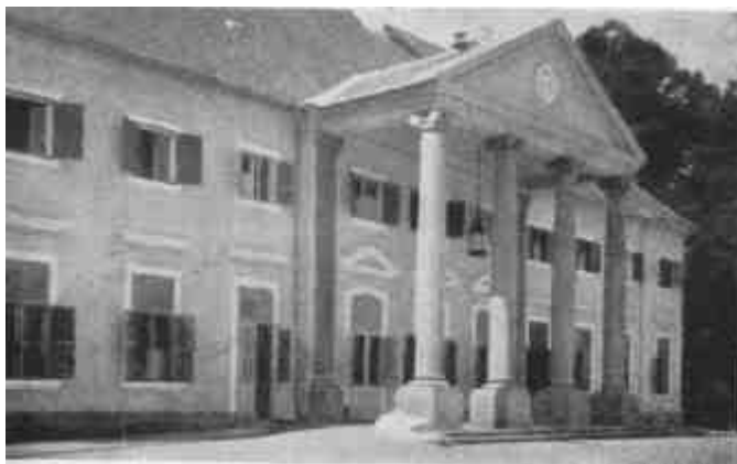
Nagyvázsonyi gróf Zichy-kastély utcai homlokzata. (Rados Jenő: Magyar kastélvok c. műből.)