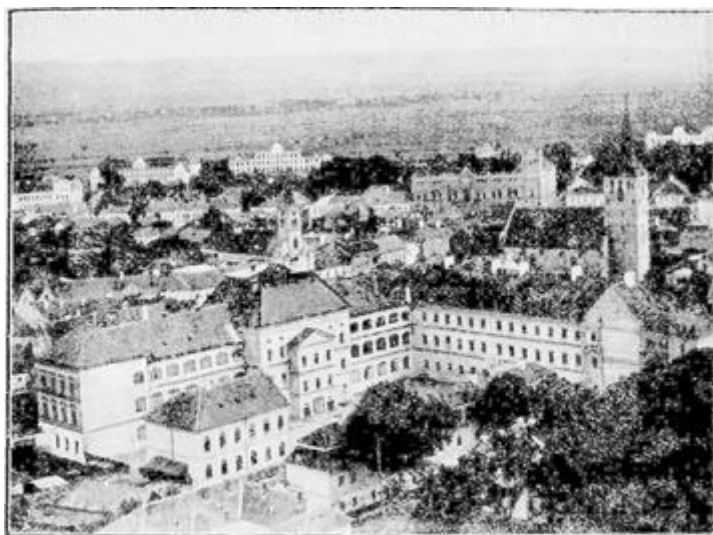
A város, előtérben a Kollégiummal