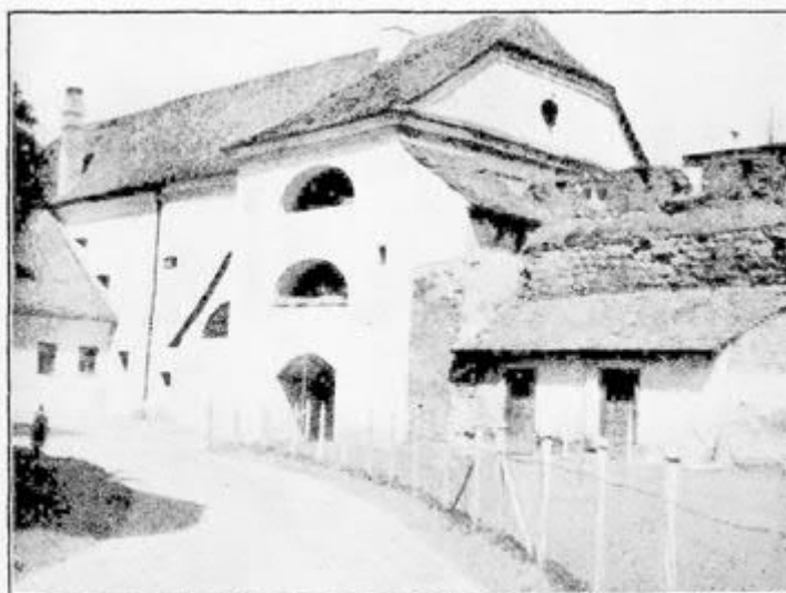
A tejedelemasszony háza