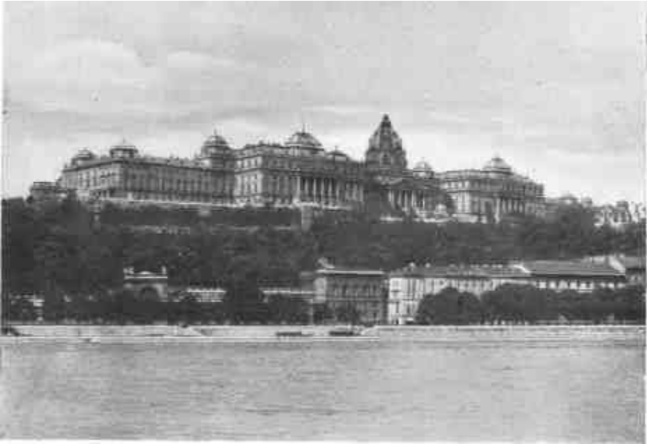
Budapest, a Királyi Vár