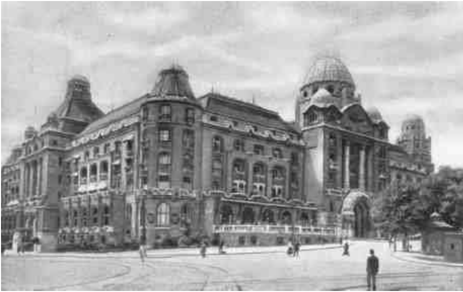
Budapest, Szent Gellért gyógyfürdő és szálloda