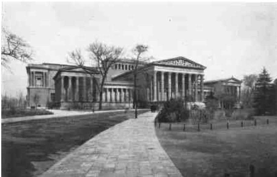
A budapesti Szépművészeti Múzeum