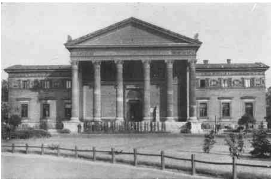
A budapesti Műcsarnok (Balogh felvétele, Petrovics „Budapest in Bildern” című műből)