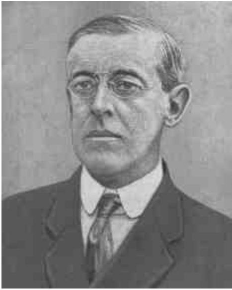
WILSON WOODROW AZ ÉSZAKAMERIKAI EGYESÜLT ÁLLAMOK VILÁGHÁBORÚS ELNÖKE.