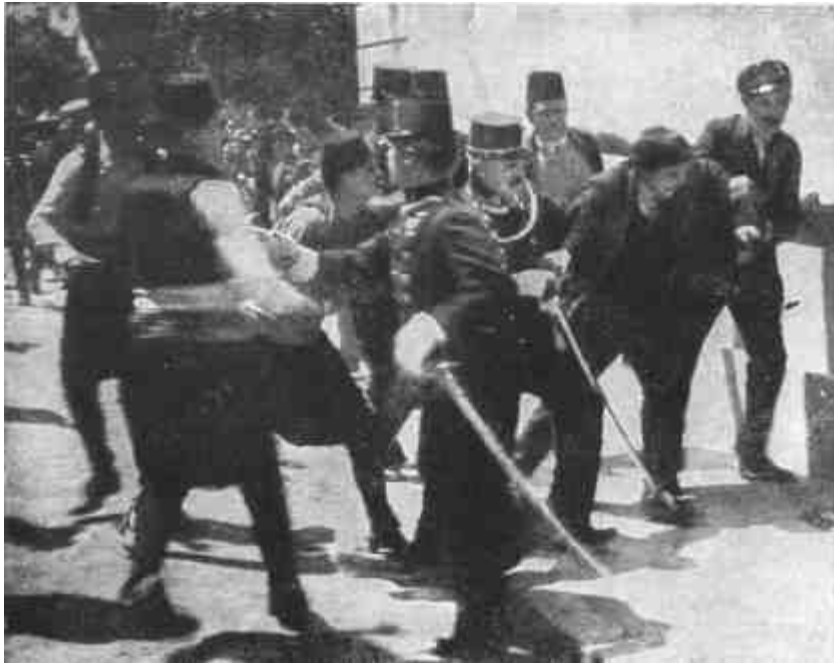
PRINCIP GAVRILLO, FERENC FERDINÁND TRÓNÖRÖKÖS GYLKOSÁNAK ELFOGATÁSA.