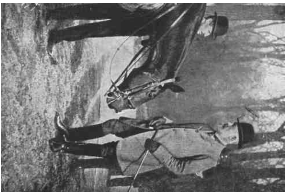
BETHMANN HOLLWEG THEOBALD MEHET PIRODALMI KASCELLAR 1914—1917 JURETIS 14-16.