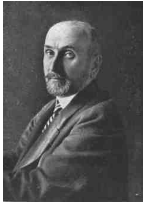
SZÁSZONOV SZERGEJ OROSZORSZÁG KÜLÜGYMINISZTERE 1910 -1916-IG.