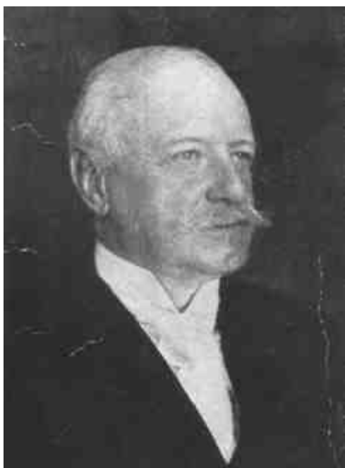
BÜLOW BERNHARDT HERCEG NÉMET BIRODALMI KANCELLÁR ÉS POROSZ MINISZTERELNÖK, MAJD NÉMETORSZÁG RÓMÁT KÖVETE (1914-1915.).