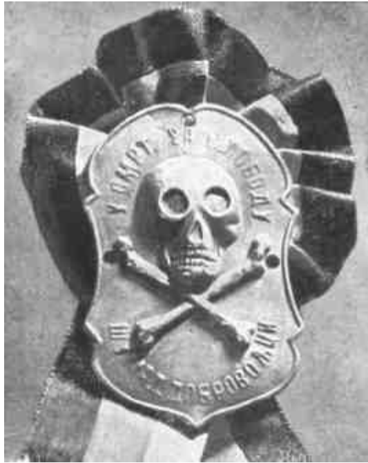
A «NARODNA ODBRANA» JELVÉNYE.