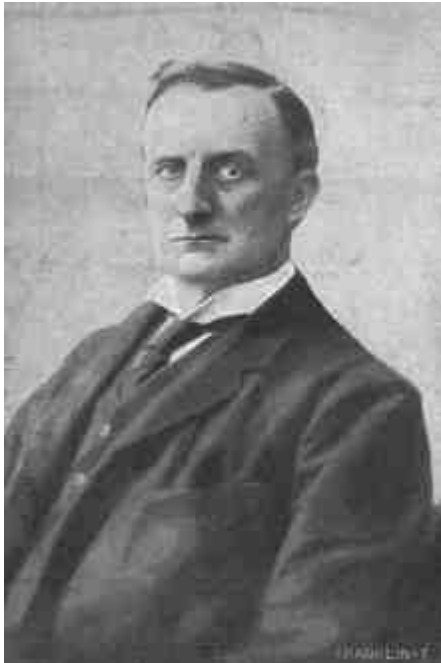
SIR GREY EDVÁRD ANGOL KÜLÜGYMINISZTER 1905-1916-IG.