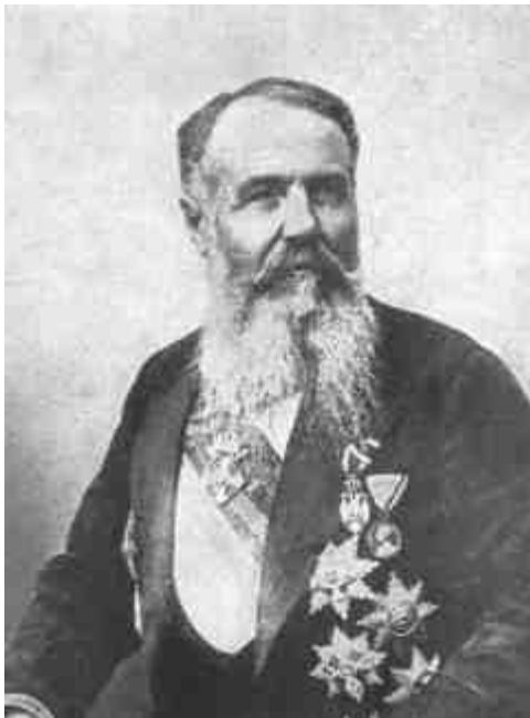
PASICS NIKOLA ÍZEBIA MINISZTERELNÖKE.