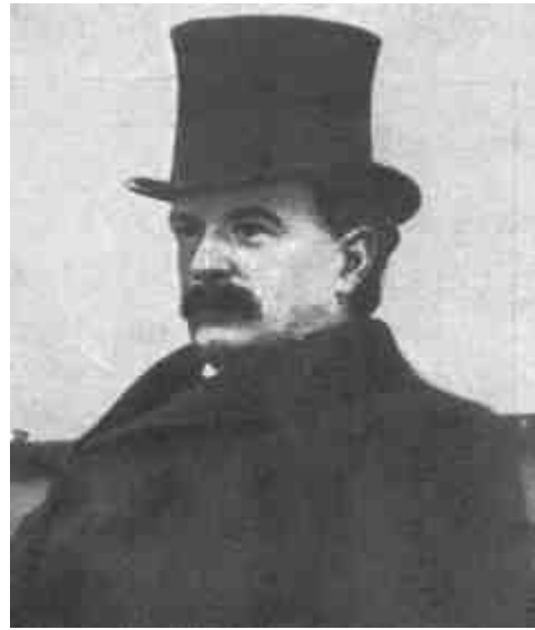
LLOYD-GEORGE DAVID ANGLIA MINISZTERELNÖKE 1916 DECEMBER HAVÁTÓL 1922 OKTÓBER HAVÁIG.