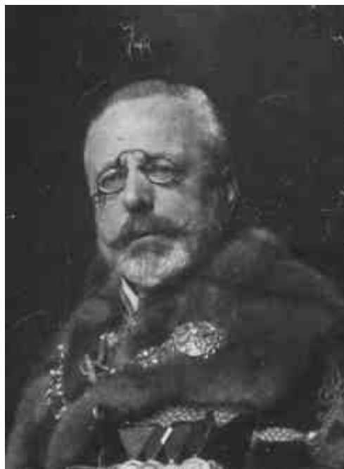
BURIÁN ISTVÁN GRÓF AUSZTRIA-MAGYARORSZÁG KÜLÜGYMINISZTERE 1915-BEN ÉS 1918 ÁPRILIS-OKTÓBER HAVÁBAN.