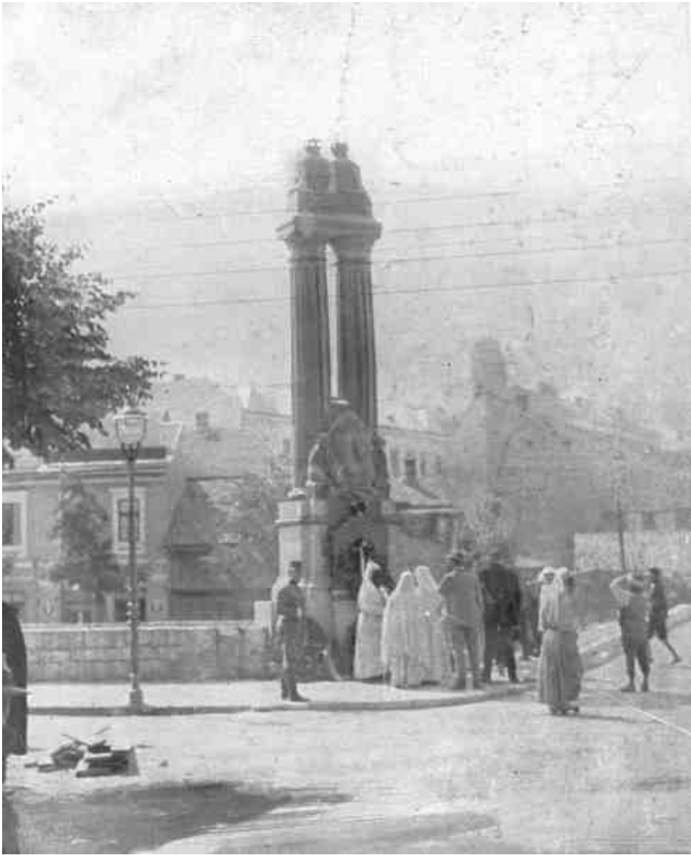
EMLÉKMŰ SZARAJEVÓBAN AZON A HELYEN, AHOL FERENC FERDINÁND TRÓNÖRÖKÖS ÉS FELESÉGE ELLEN GYILKOS MERÉNYLETET KÖVETEK EL.