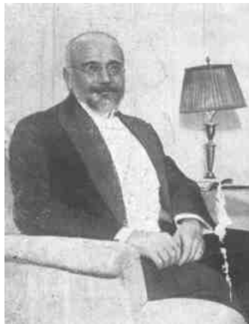
VENIZELOSZ ELEUTHERIOS GÖRÖGORSZÁG ENTENTE-BARÁT MINISZTERELNÖKE.