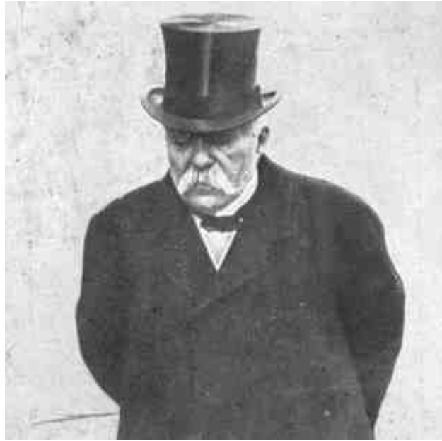
CLEMENCEAU GYÖRGY A FRANCIA KÖZTÁRSASÁG MINISZTERELNÖKE ÉS HADÜGYMINISZTERE 1917. NOVEMBER HAVÁTÓL 1920. JANUÁR HAVÁIG.