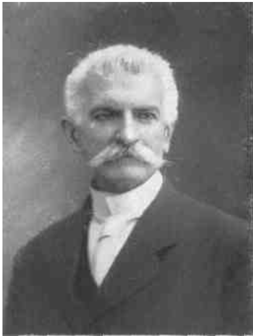
SONNINO SIDNEY BARÓ OLASZORSZÁG KÜLÜGYMINISZTERE 1914-1919-IG.