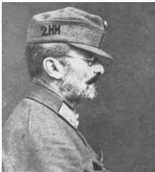
TISZA ISTVÁN GRÓF MINT A 2-IK HONVÉD HUSZÁREZRED PARANCSNOKA.