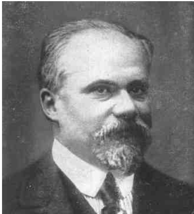
POINCARÉ RAYMOND A FRANCIA KÖZTÁRSASÁG ELNÖKE 1913-1920-IG.