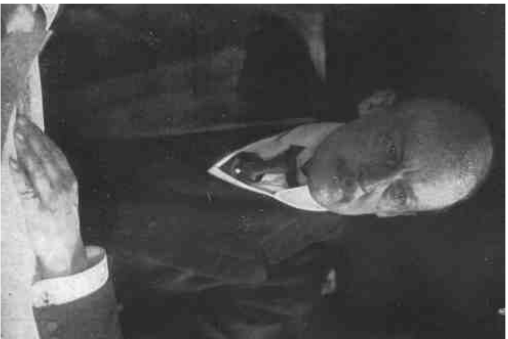
HEINRICH LIPOŦ GRÖF AŦRIETRIA-TRAGVAROREŽIJA KIŠEBOUMNISISTILIA 1912—1915 JANUAR HAVAJIC.