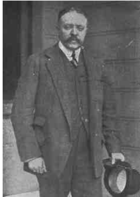
IZVOLSZKIJ ALEXANDER OROSZ DIPLOMATA ÉS PÁRIZSI NAGYKÖVET