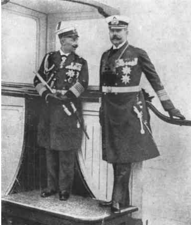
II. VILMOS NÉMET CSÁSZÁR ÉS FERENC FERDINÁND TRÓNÖRÖKÖS A NÉMET FLOTTAGYAKORLATOKON.