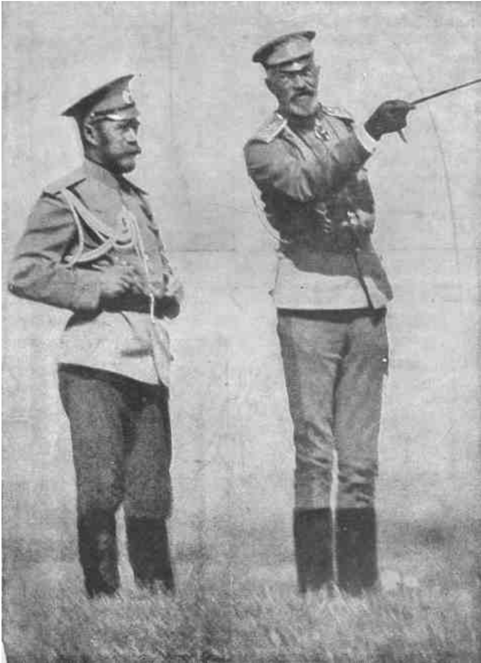
II. MIKLÓS OROSZ CÁR ÉS NIKOLAJ NIKOLAJEVICS OROSZ NAGYHERCEG, AZ OROSZ HADERŐK FŐVEZÉRE 1914-1915-BEN.