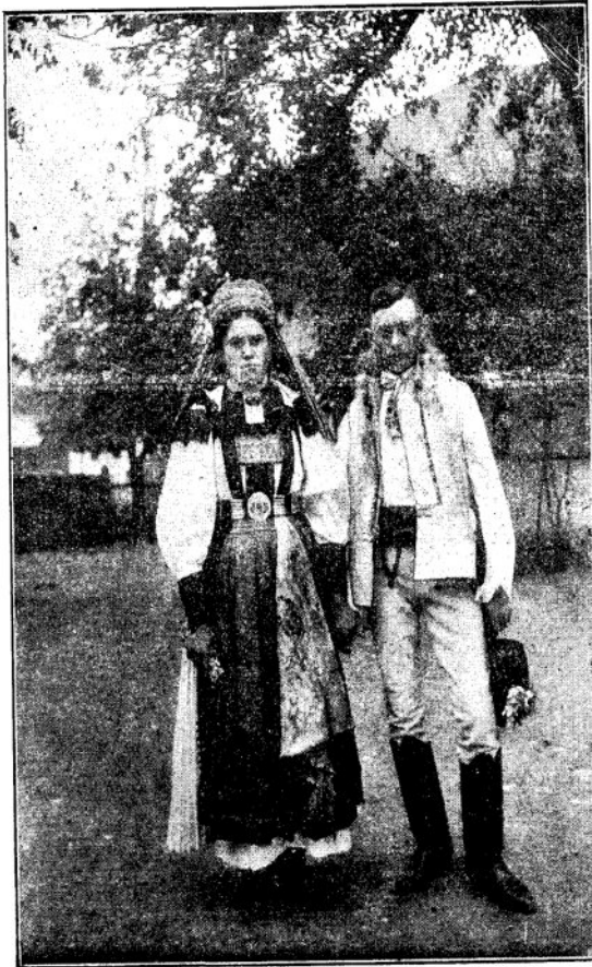
Torockói leőnény és leány

talánul földesúri hatalom alá jutott s majd háromszázötven éves sikertelen küzdelem után végre is csak az 1848-i általános elszabadulással került ki a méltatlan igából. Kétszer erőszakkal is megkísérelte lerázni a jármot s 1702-ben vértanúi estek áldozatul szabadságháborújának. A hagyomány szerint az akkor