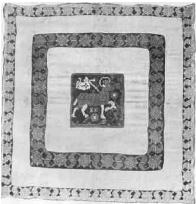
Árva Bethlen Kata úrasztali térítője 1735-ből. Olthévíz, ref. egyház.