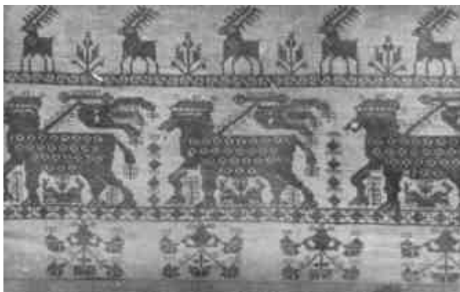
Szász párnahéj, piros pamut. Erdély.