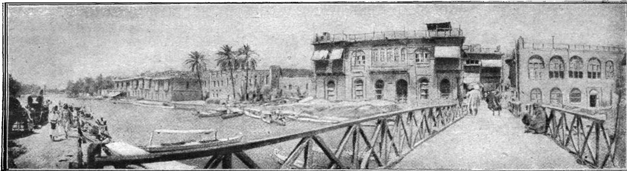
Basra a Tigris-folyó partján.