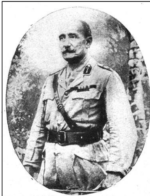
Sir John Nixon angol tábornok, a mezopotámiai hadsereg egyik parancsnoka.

Törökország hadereje nem engedte meg nagyobb csapatrészeknek a Perzsa-öbölbe való kikülönítését s így a törökök nem is számíthattak arra, hogy a hadihajókkal is támogatott angolok partraszállását megghiúsíthatják. Egyelőre csak annyi állott hatalmukban, hogy az angolokat a további előnyomulásban a lehetőség szerint feltartóztassák s az ellenségnek lehetőleg nagy veszteségeket okozzanak. Erősítéseket küldeni — ezt is csak korlátolt