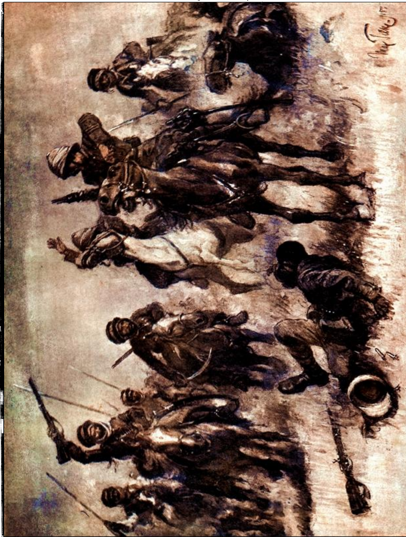
A mezopotámiai harcokból:

Török önkéntes lovasság meglepő támadással foglyul ejt egy angol felderítő lovasörjáratot.