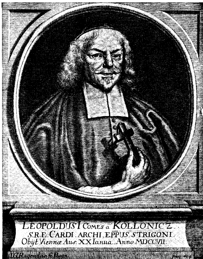
Gr. Kolonicz Lipót esztergomi érsek.

szerve, kényszerítő eszköze, a fegyveres erő, mint magyar katonaság fokozatosan majdnem egészen elenyésztetett s helyébe Magyarország idegen állami hatalom rendelkezése alá eső fegyveres erővel árasztatott el, mintha meghódított ország lett volna amennyiben némi magyar katonaság mégis megmaradt, az idegen állami hatalom rendelkezése alá helyeztetett.