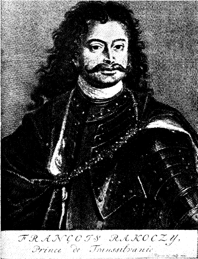
II. Rákóczi Ferenc. (A Histoire des revolutions I. kötetéből.)