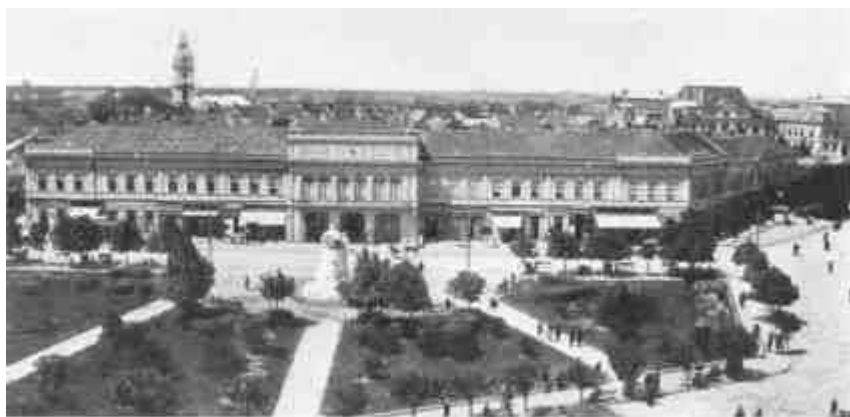
Nyíregyháza, Kossuth-tér és Városháza