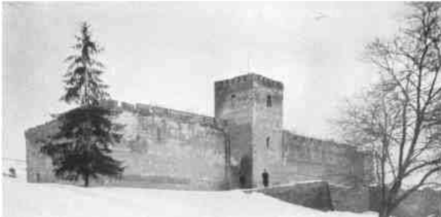
A gyulai vár