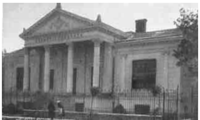
Békéscsaba, a Közművelődési Ház