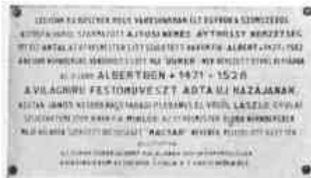
A gyulai Dürer-emléktábla