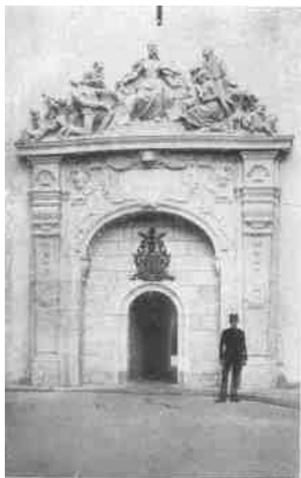
A soproni hűségkapu