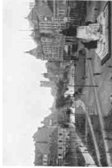
Debrecen, Nagyteremphely-tér és Kossuth-szoborral