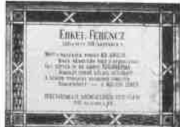
A gyulai Erkel-emléktábla