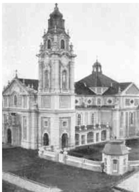
A zalaegerszegi Karoly-templom