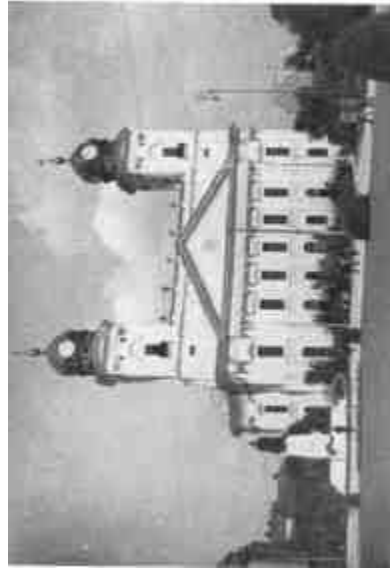
Debrecen, Református Nagytemplom