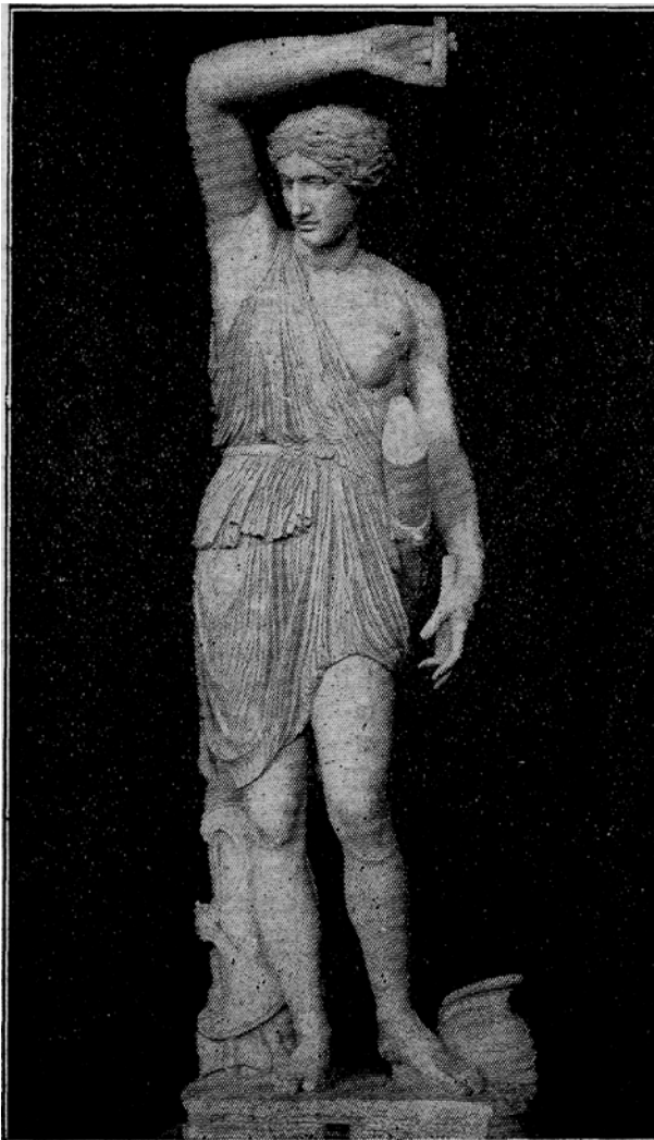
Az antik világ femnizmusa

Tessék kérem megfigyelni: Tíz gyermeke van. Kilenc hónap óta koplal, de azért a felesége megint várandós. A munkás pedig most maga is olyan beteg, hogy még ha kaphatna is munkát, nem dolgozhatna. Reméljük, hogy az asszony holnapután talál egy kutat ahová a tizenegy gyereket, a beteg férjét és tehetetlen önmagát beledobhatja.