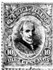
Levélbélyeg Garcia Moreno képével.

„A haza újjáalkotójának, a hit rettenthetetlen bajnokának.”