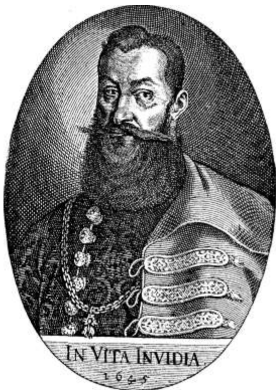
GALÁNTHAI ESTERHÁZY MIKLÓS GRÓF Magyarország nádora.