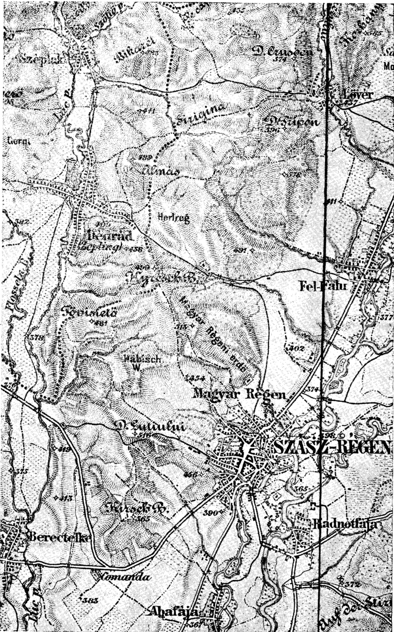
4. A szászrégeni ütközet színhelye. (1: 75,000).