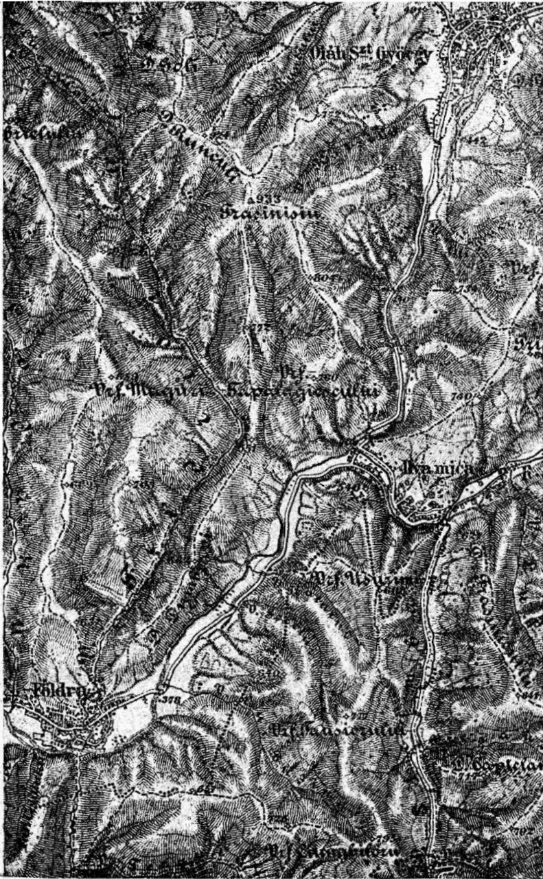
3. A Kisilva és Földra közötti ütközet színhelye (1: 75.000).