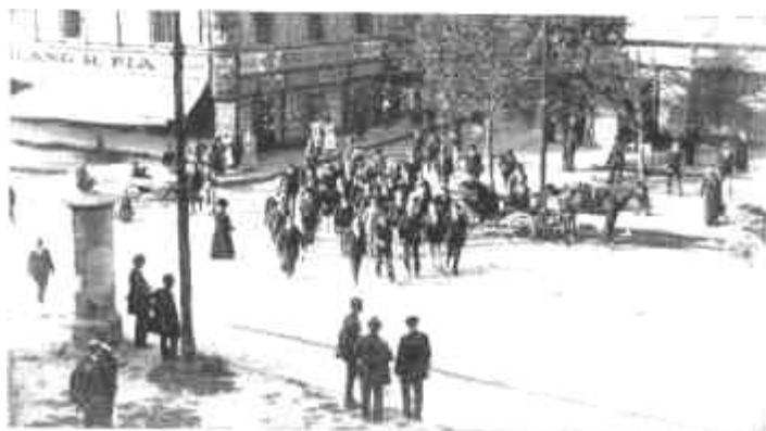
Amikor 1920 szeptember 29-én a magyar kommunista vezetők Pécs városházán indultak, a közigazgatási hatalom útjábólra.