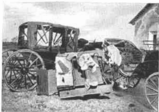
Fegyvernek, Őszetört kocsiik, amelyeknek bőrrészeit a románok elvitték.