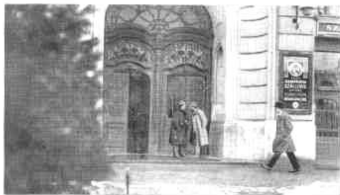
Szorb őrség a pilseni városi ház kapujában.