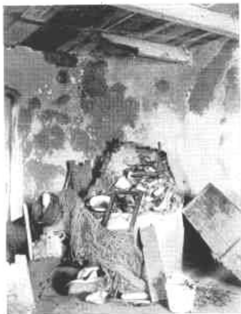
Pécs, Szerb pusztítás a megsemmítés végén.