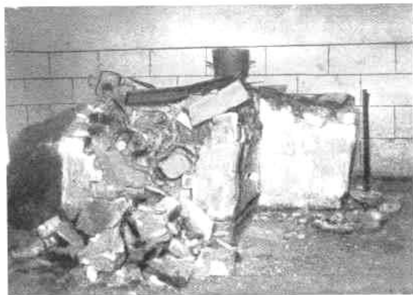
Pécs, Elpusztított kályha maradványai egy középületben a szerb rombolás után.