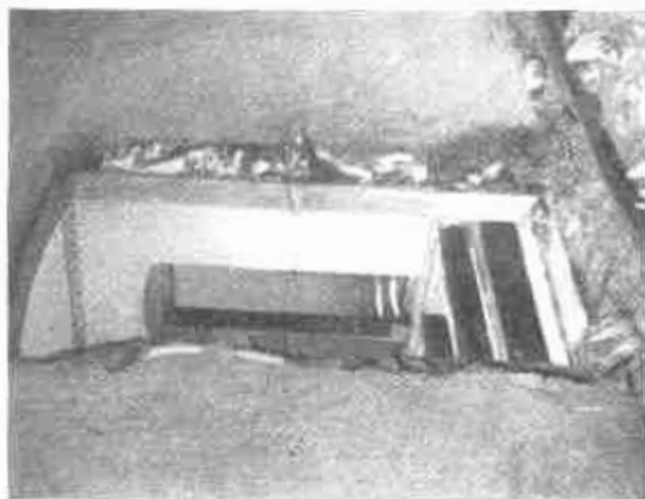
Pecs. Így garázdálkodtak a szerbek a megszűlés alatt a közpályerőben.