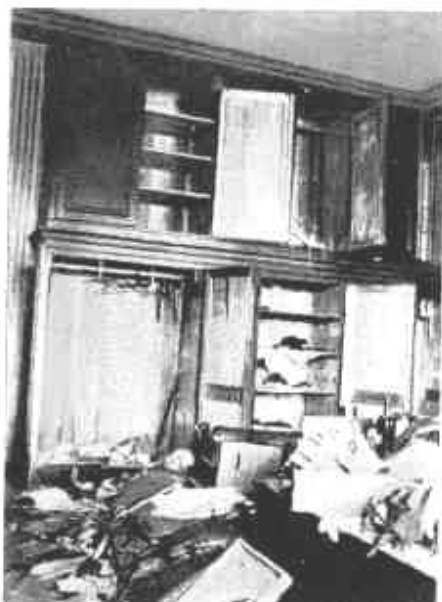
Fogyvernek. Falhatót a román pusztítás után.