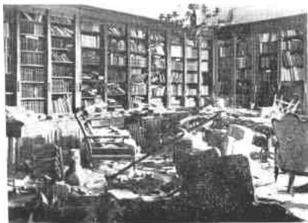
Taksony. A gróf Szapáry-kastély könyvtára. A román megszállás eredménye.