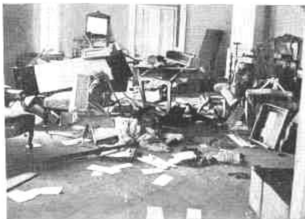
Taksony. A gróf Szapáry-kastély egy szobája a románok kivételése után.