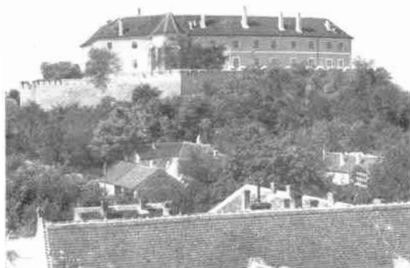
Siklód. A moerulőket képező vár, amelyben a szerbek nagy károkat okoztak.