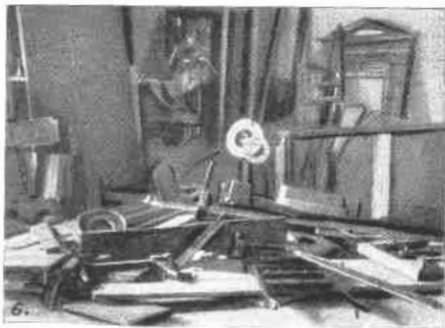
Fegyvernek. Egy hálszoba romjai, amit a román megszállás szószőlő.