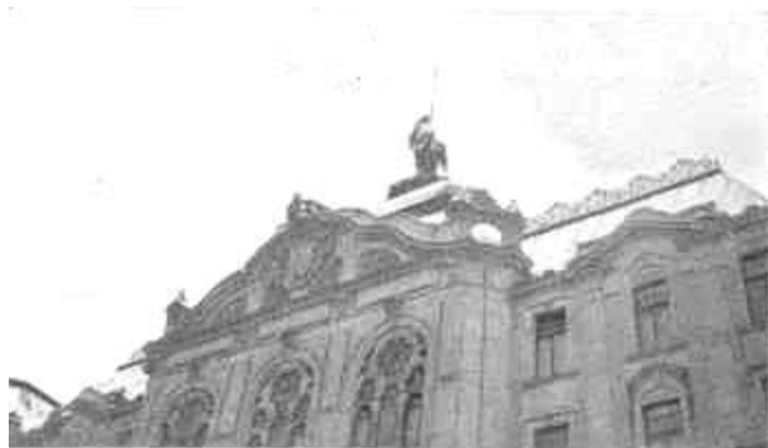
A magyar zászló eltávolítottán Pilsen városi háza tornyáról szorb és kommunista segédlettel.