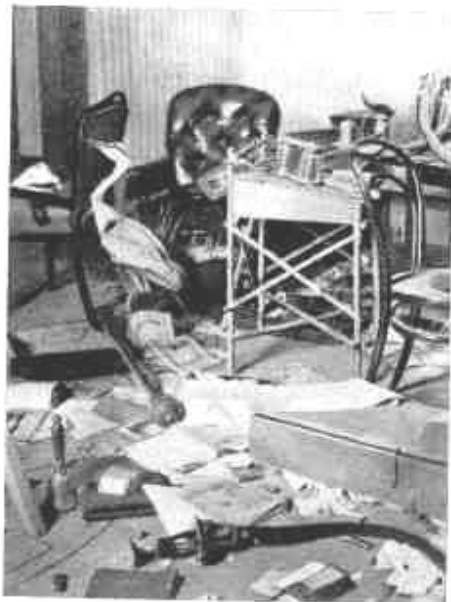
Fogyvernek. Egy szoba a román pusztítás után.