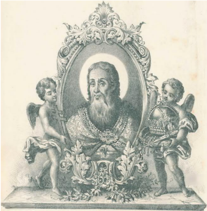
Szent István Király