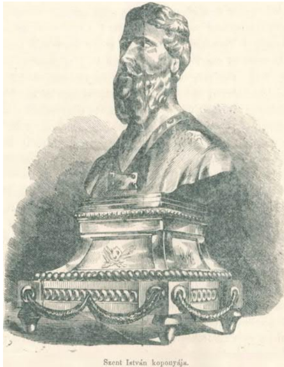
Szent István koponyája.

Ezen szent Jobb az, melynek tiszteletére Szathnár megyében Szent Jobb kolostort építettek a buzgó utódok, hogy méltó helye legyen a király ereklyéjének.