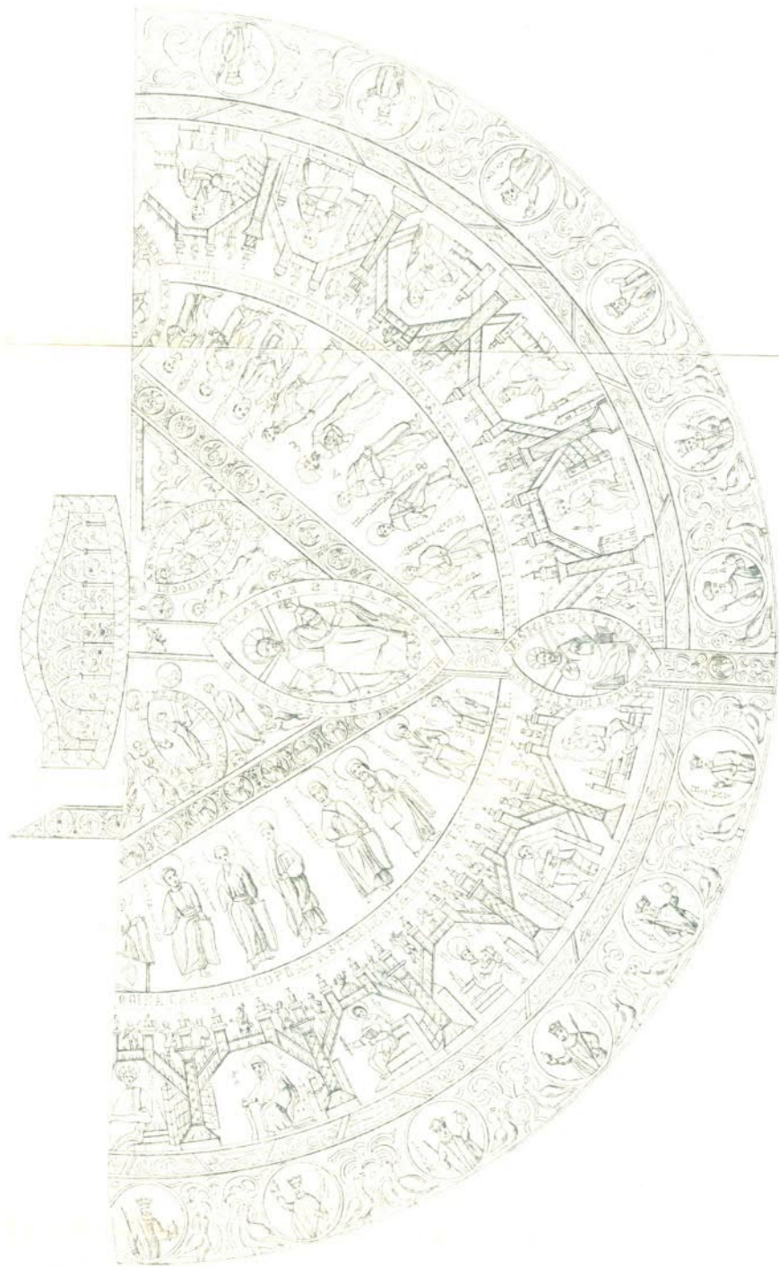
SZ. ISTVAN KIRÁLY PALÁSTJA.