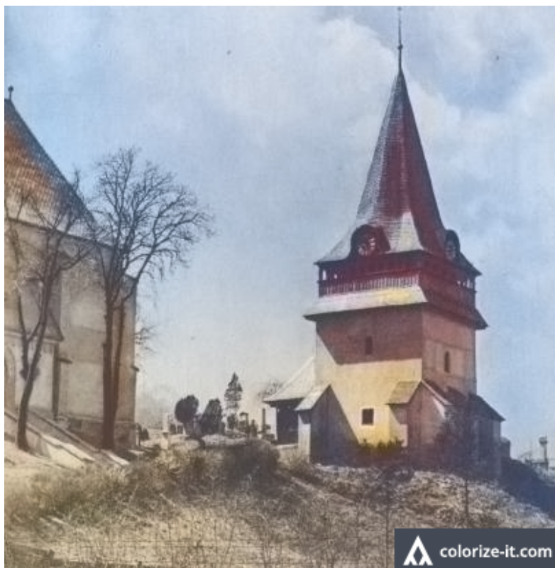
Az avasi harangtorony