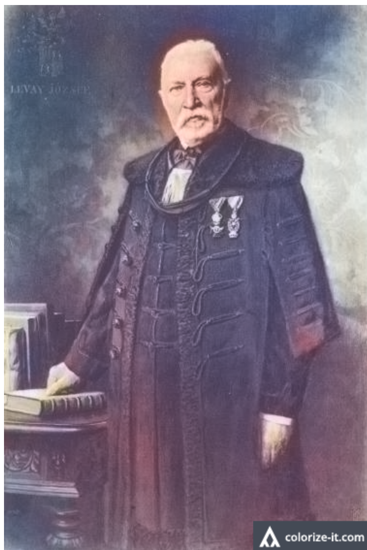
Lévay József Stetka Gyula festménye Borsodvármegye megyeházának nagytermében